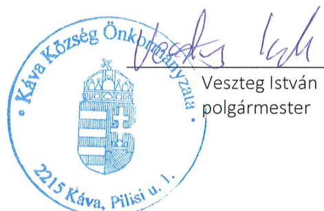
Veszteg István polgármester

Több napirendi pont nem lévén a polgármester 11:00 órakor a bezárta az ülést.